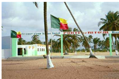
La porte du retour, Ouidah, Bénin

Que tous ensemble, nous nous engageons résolument à reconnaître et valoriser toutes les initiatives africaines qui portent en elles le Savoir et la Sagesse de leurs pères.