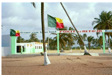
La porte du retour, Ouidah, Bénin

Que tous ensemble, nous nous engageons résolument à reconnaître et valoriser toutes les initiatives africaines qui portent en elles le Savoir et la Sagesse de leurs pères.